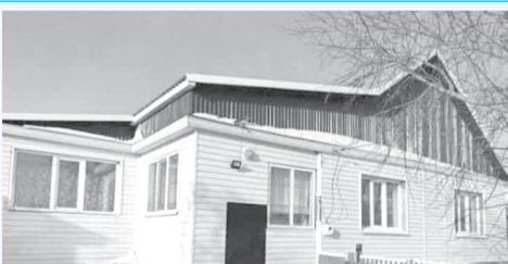
Үй сатамын. Үйдің ішінде барлық жағдай жасалған. Сатылатын баға келісімді. Байланыс телефоны 87078352668