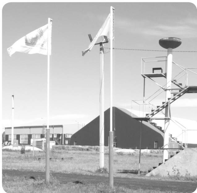
Аудандық ардагерлер ұйымының жұмысы, мерекелік іс шаралар кезіндегі

сол спорт ойындарына қатынасып, өз өнерлерін ортаға салып жүрген ардагерлеріміздің бұл еңбегін ерлікке теңестіруге болады. Өздерінің егде жастарына қарамай, мерекелік іс-шараларға қатынасып, кейінгі жастарға үлгі болып жүрген қарияларға бар дауыспен «Тек қана Алға!» дейміз.