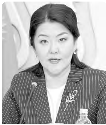
Ажар ГИНИЯТ, ҚР Денсаулық сақтау министрі.

Қазақстан Республикасы Мемлекеттік қызмет істері агенттігінің Солтүстік Қазақстан облысы бойынша департаменті басшының орынбасары, Әдеп жөніндегі кеңес хатшылығының меңгерушісі.